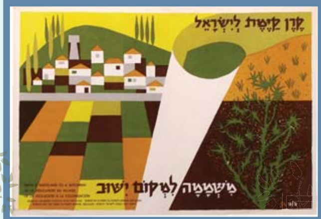
עיצוב: דוד ז"ק, ארכיון הצילומים של קק"ל.

התבוננו בכרזה שלפניכם, שהפיקה קרן קיימת לישראל: