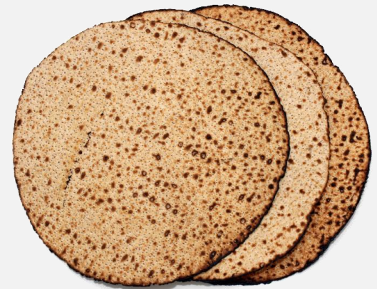
מצה בעבודת יד