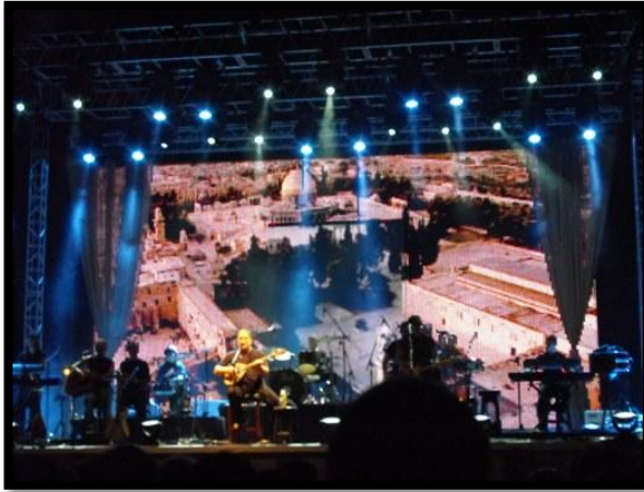
שמחת חג הסוכות בהופעה חיה של יהודה פוליקר. באמפיטאטרון ראשון לציון 2011