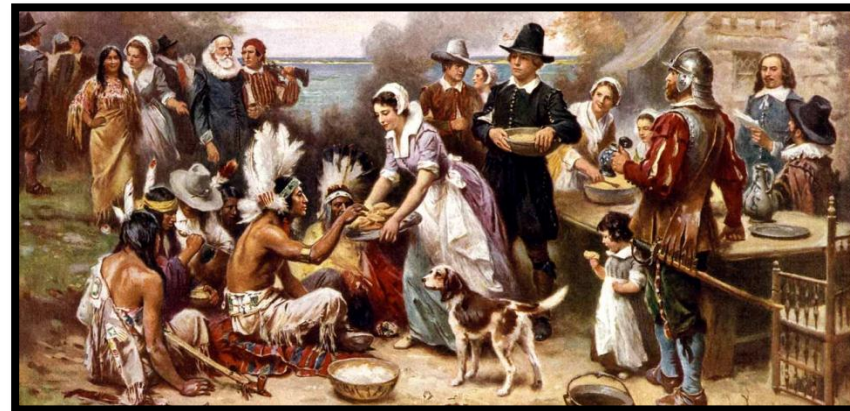
הציר: ז'אן לואי ג'רום פריס