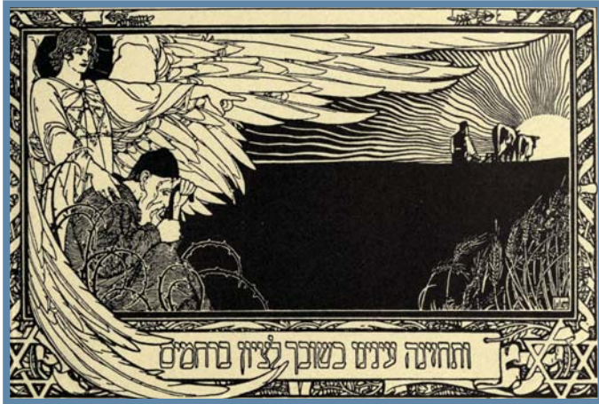
כרזה לקונגרס הציוני החמישי מאת אפרים משה ליליין

כשבית המקדש היה קיים, עם ישראל התקיים בעיקר מעבודת אדמה. גם לאחר חורבן בית המקדש עבדו את האדמה, אך היישוב היהודי הלך והתדלדל עם השנים, ובגלות מרבית היהודים לא עסקו בחקלאות. בימי ראשית הציונות, כשנפוץ רעיון שיבת עם ישראל לארצו ופעילים ציוניים פעלו להגשים אותו, התעוררה אצל רבים מהם השאיפה לשוב ולעבוד את האדמה. הכרזה ממחישה זאת: